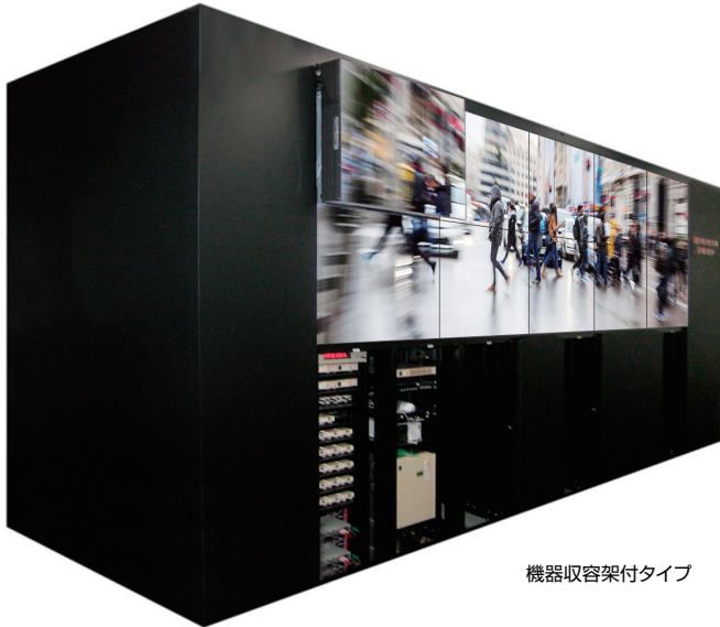
機器収容架付タイプ